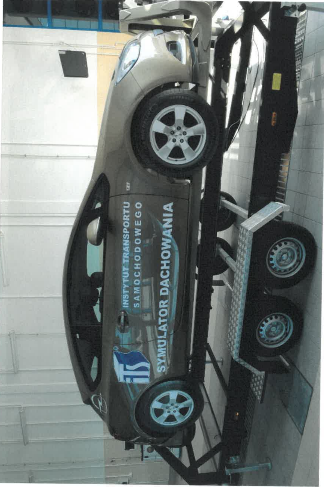
Zdjęcie nr 1 – symulator dachowania