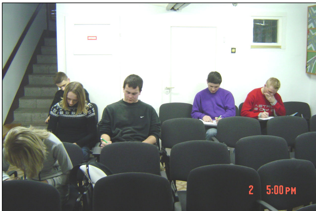
Kursanci wypełniający ankiety