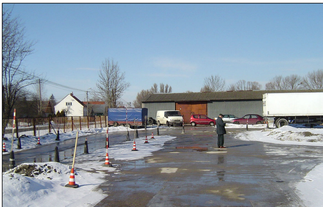
Plac manewrowy ośrodka