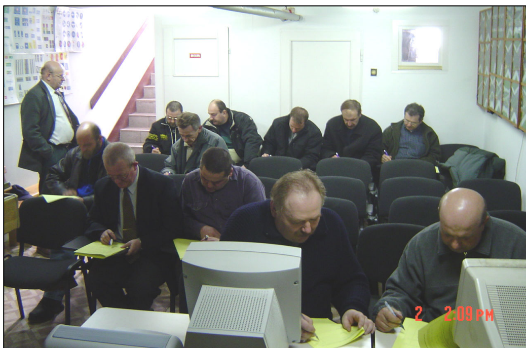
Instruktorzy wypełniający ankiety