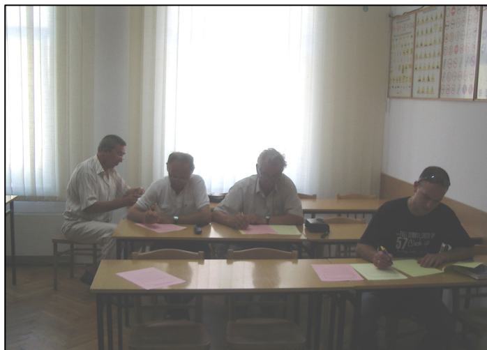
Instruktorzy podczas wypełniania ankiet