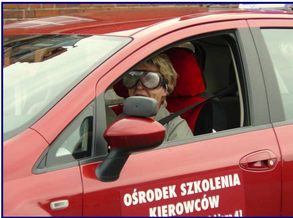
Jazda w autogoglach