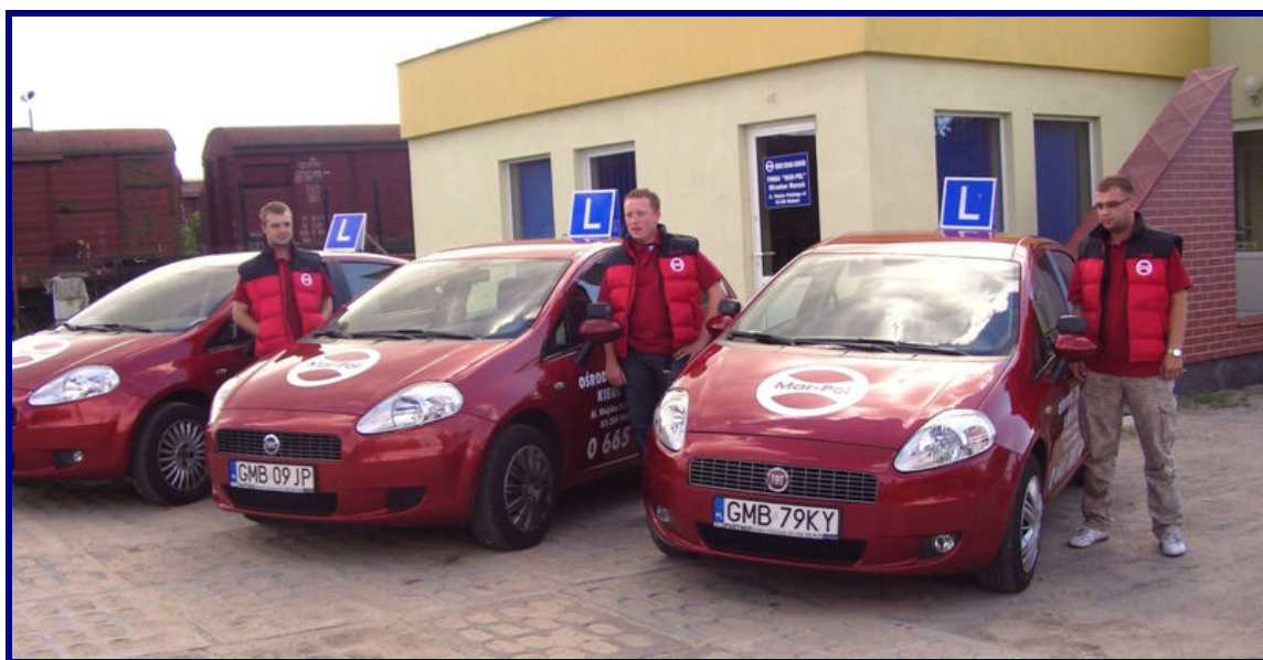
Instruktorzy i tabor samochodowy ośrodka