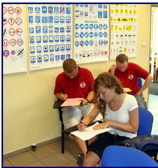
Wypełnianie ankiet przez kursantów i instruktorów