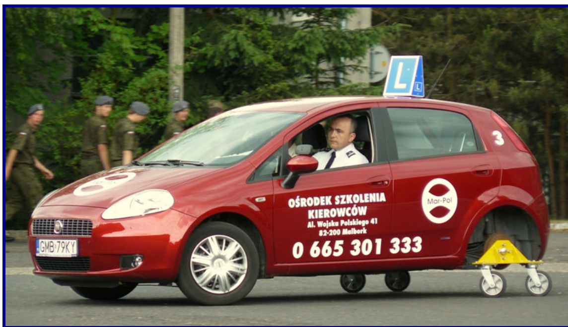
Doskonalenie techniki jazdy na trolejach