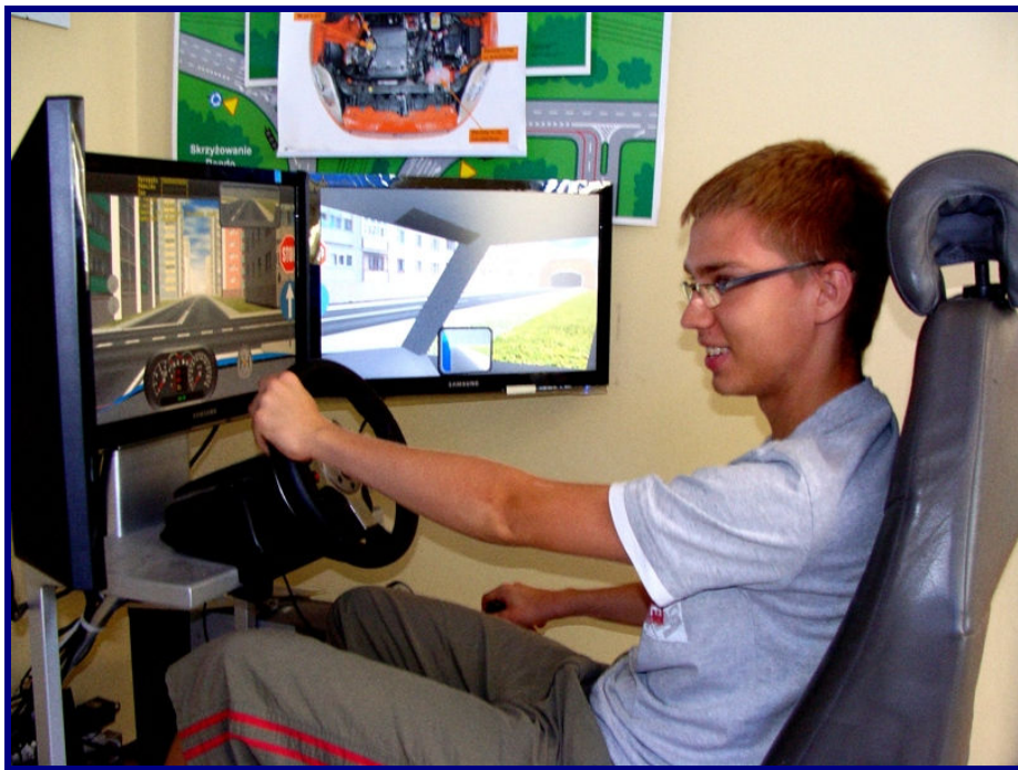
Zajęcia na symulatorze jazdy